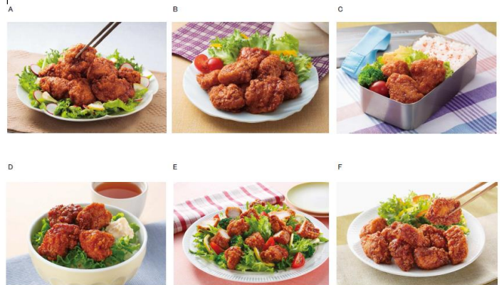
左上から横にA~C、左下からD~F

■概要 (子育て:40歳未満 ファミリー:40歳以上55歳未満 シニア:55歳以上)