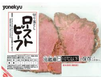
① 切り落としローストビーフ65g

「北海道産牛塩ローストビーフ」:①購入したことがない 72.6% ②無回答 11.3% ③添付のたれ 8.1% ④その他 6.5% ⑤ポン酢 4.8%