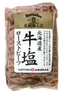
④ 北海道産牛塩ローストビーフ170g