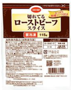
② 切れてるローストビーフスライス115g