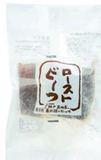
③ 神戸三田屋ローストビーフ150g ポンズソース20g