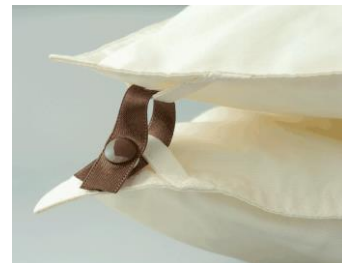
2枚を合わせて 「2枚合わせ羽毛掛けふとん」 として使えます

■概要(子育て:40歳未満 ファミリー:40歳以上55歳未満 シニア:55歳以上65歳未満)